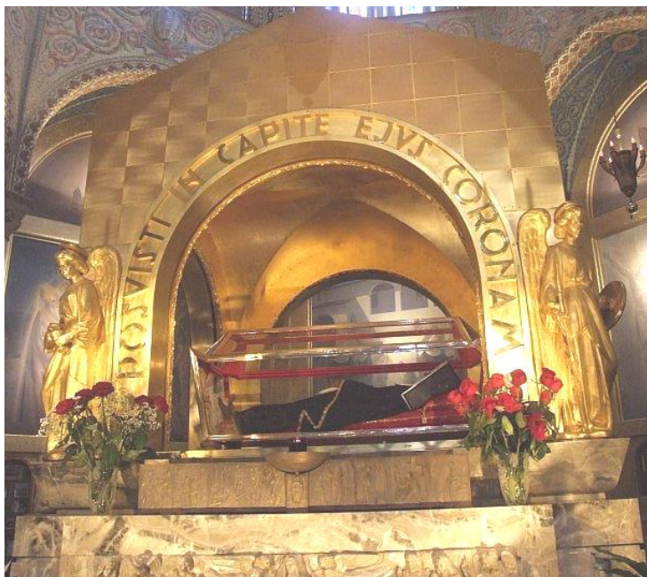
Szent Rita üvegekoporsóban a casciai Szent Rita-templomban